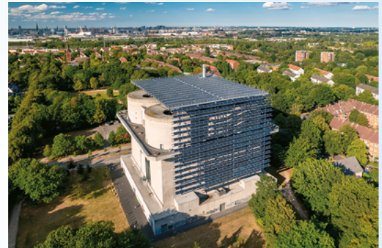
Energiebunker Hamburger Energiewerke